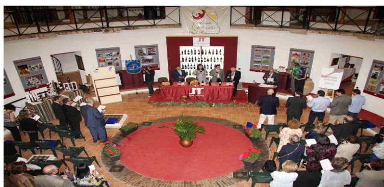
Tercera Edición Premios Summum Vinum 2010